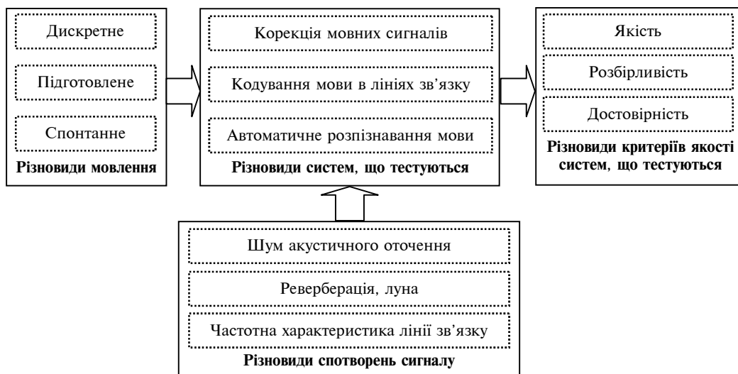
Рис. 1. Схема тестування системи обробки мовних сигналів

Врахування різновидів спотворень сигналів означає таке: за умов, коли відпрацьовуються алгоритми придушення шуму акустичного оточення, достатнім є моделювання мовного сигналу y(t) у вигляді адитивної суміші чистого мовного сигналу x(t) й шумового процесу n(t) :