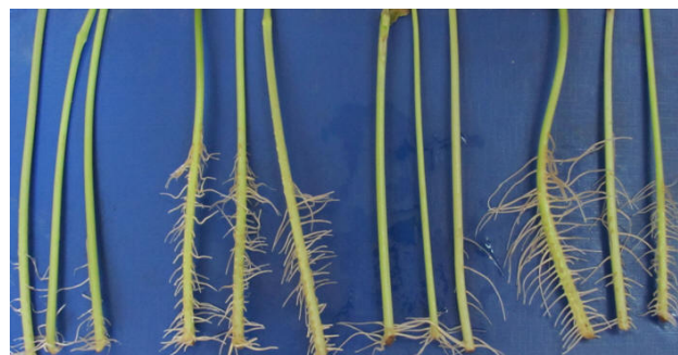
Контроль ІМК 5 мг/дм 3 РБК 10 мг/дм 3 ІМК 5 мг/дм 3 + РБК 10 мг/дм 3

досліджених СКР і РБК. Це свідчить про перспективність використання рамноліпідних ПАР при створенні комплексних препаратів з фітогормонами ауксинової природи.